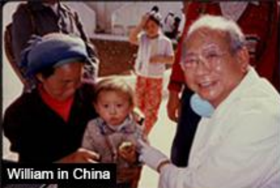
William in China