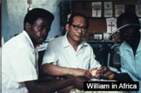
William in Africa